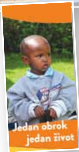
Jedan obrok jedan život

Papinska misijska djela u Republici Hrvatskoj i ove godine organiziraju korizmenu akciju za pomoć misijama. Ove godine prenose molbu o. Tomislava Mesića, misionara u Tanzaniji, koji moli za pomoć u prehrani djece u vrtiću u njegovoj Misiji Monduli Juu. Malo afričko selo Monduli Juu smjestilo se na sjeveru Tanzanije, u blizini grada Arushe. Mi-